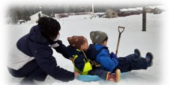
たくさんの雪でそり遊び