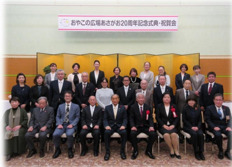
おやこの広場あさがお20周年記念式典